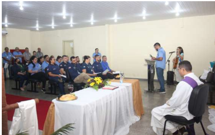
Celebração da missa de Páscoa no Instituto Penal Antônio Trindade.