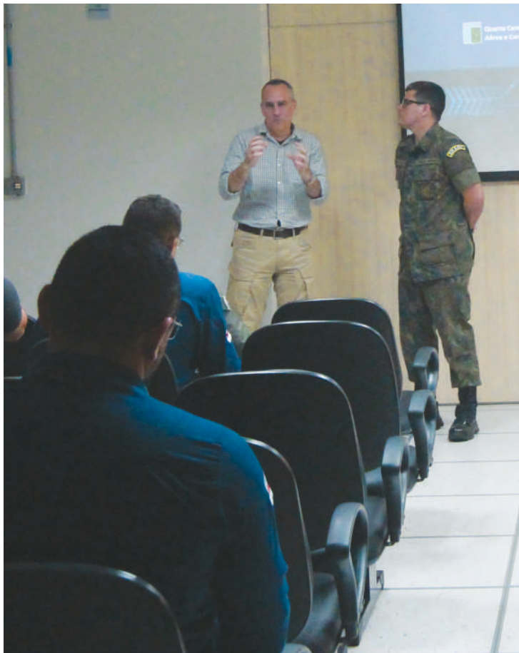
Seap participa de instruções no IV Centro Integrado de Defesa Aérea e Controle de Tráfego Aéreo [CINDACTA].