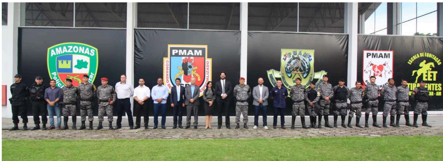
Assinatura do Termo de Cooperação Técnica entre Seap, UEA e Polícia Militar do Amazonas.