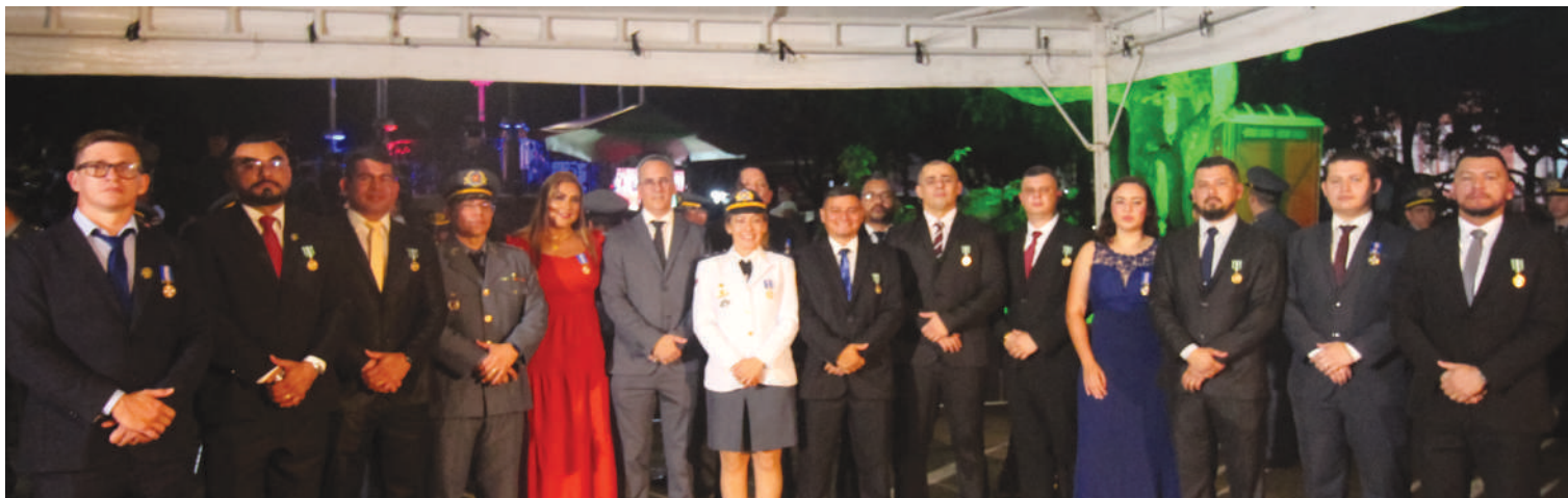
Servidores da Seap são condecorados pela Polícia Militar do Amazonas com a Medalha Tiradentes e Mérito Policial Militar.