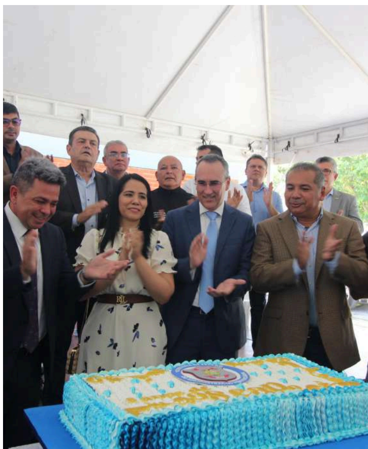
Celebração de 08 anos de criação da Seap.