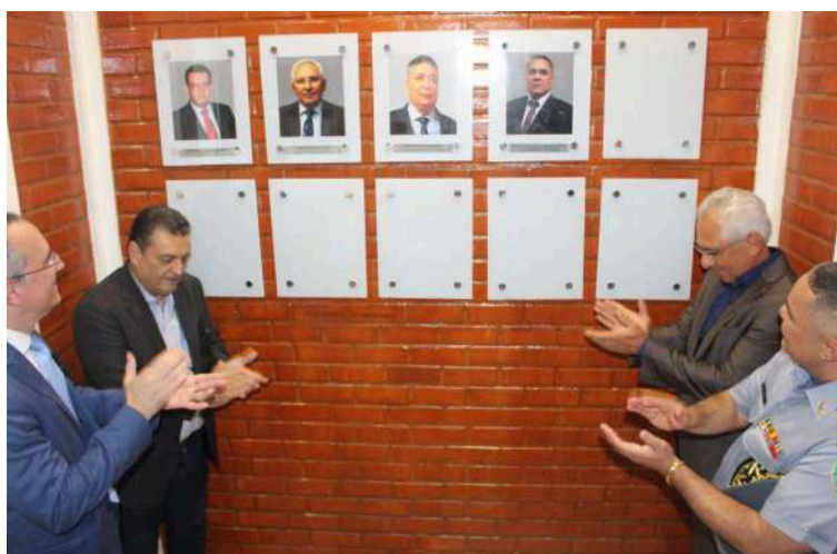
Inauguração da Galeria de Secretários Seap.