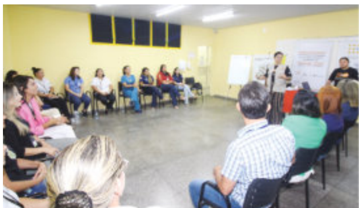
Servidores da Seap participam de encerramento de roda de conversa da UNFPA.