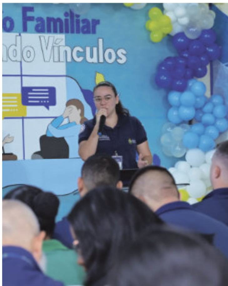
Realização do Projeto Conexão Familiar no CDF.