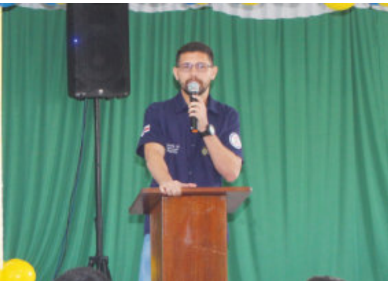
Lançamento do Projeto Vida Nova no Compaj.