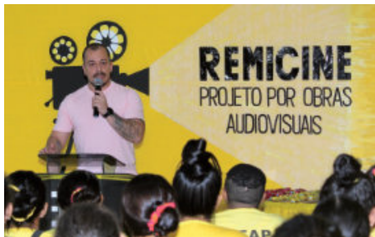
Lançamento do Projeto Remicine no Centro de Detenção Feminino (CDF).