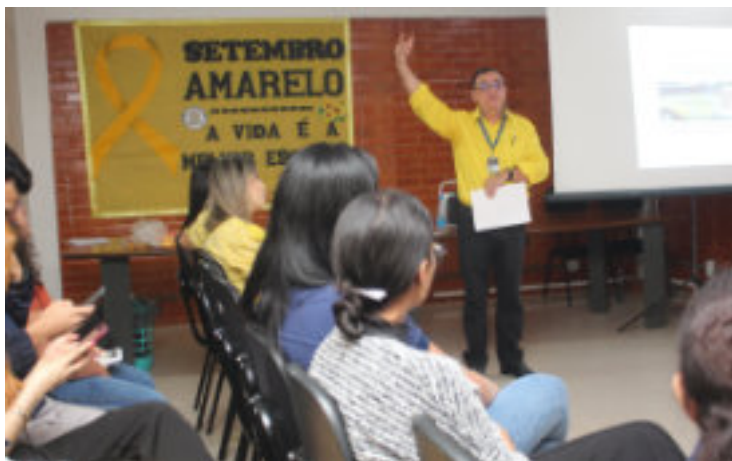
Abertura da Campanha Setembro Amarelo na sede.