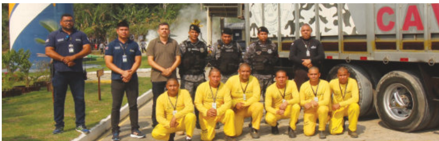
Seap entrega caminhão baia reformado ao Regimento de Policiamento Montado Coronel Bentes (RPMont).