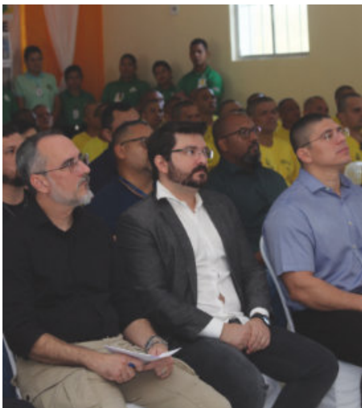
Reinauguração do Pavilhão I no COMPAJ.