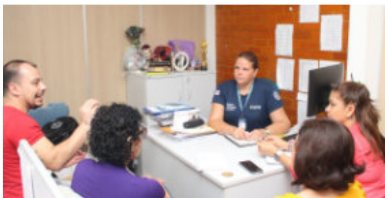
Seap participa de reunião com representantes do IFAM.