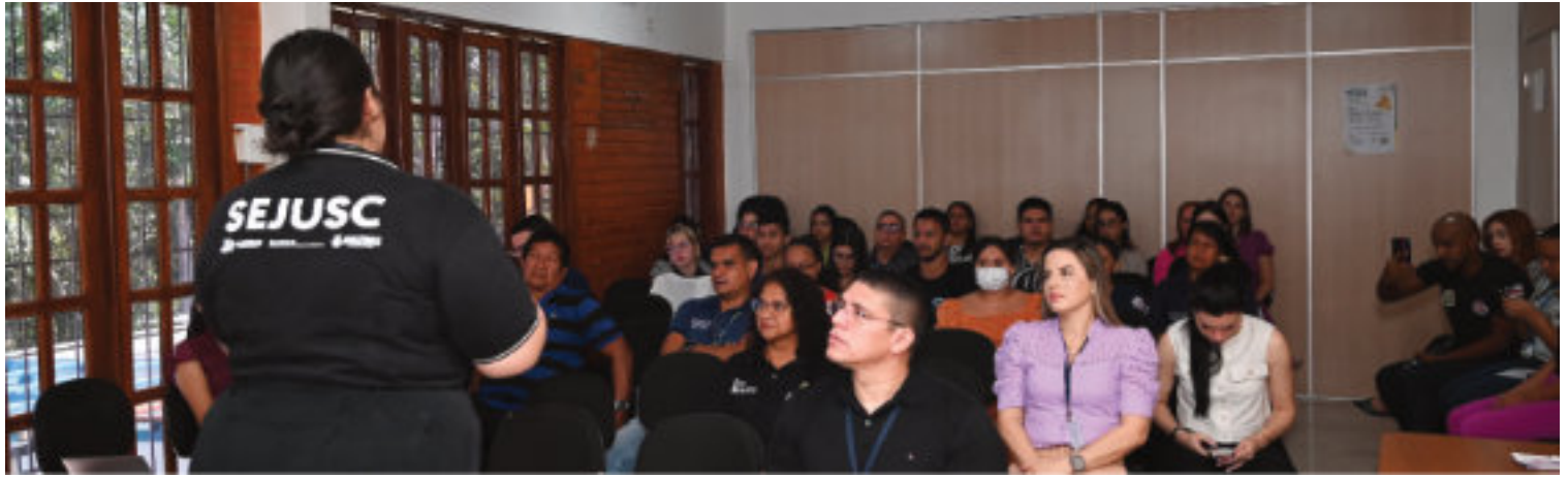
Abertura da Campanha "Agosto Lilás" na sede.