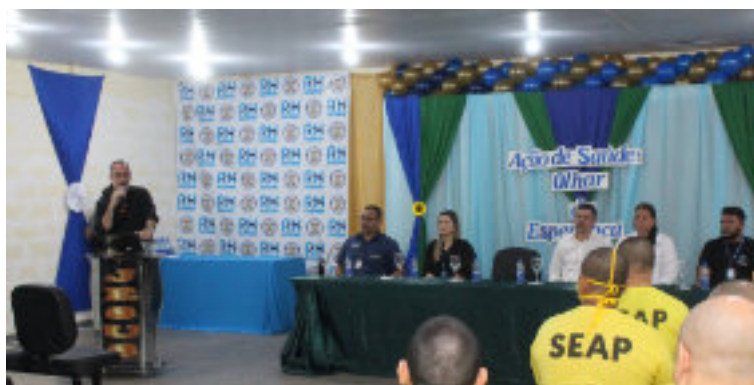
Lançamento da ação de saúde "Olhar da Esperança".