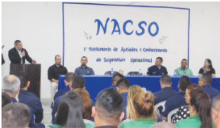
Abertura do 1º NACSO realizado na Companhia de Operações Especiais.