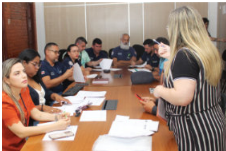
Representantes da Seap em reunião integrada de saúde.