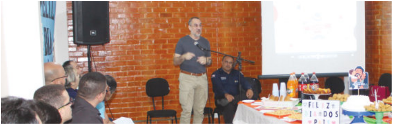
Celebração de Dia dos pais, na sede de Secretaria.