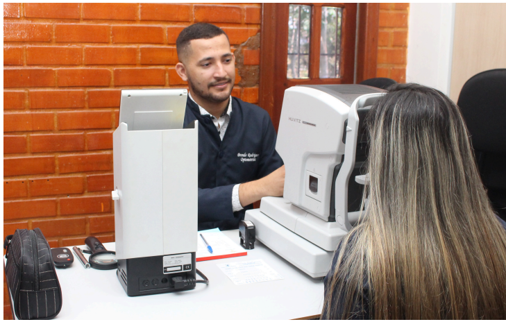
Ação oftalmológica realizada na sede da Secretaria. Julho de 2023