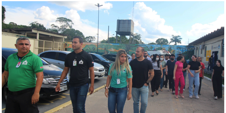
Seap recebe visita técnica supervisionada da Escola de Direito UCA. Julho de 2023