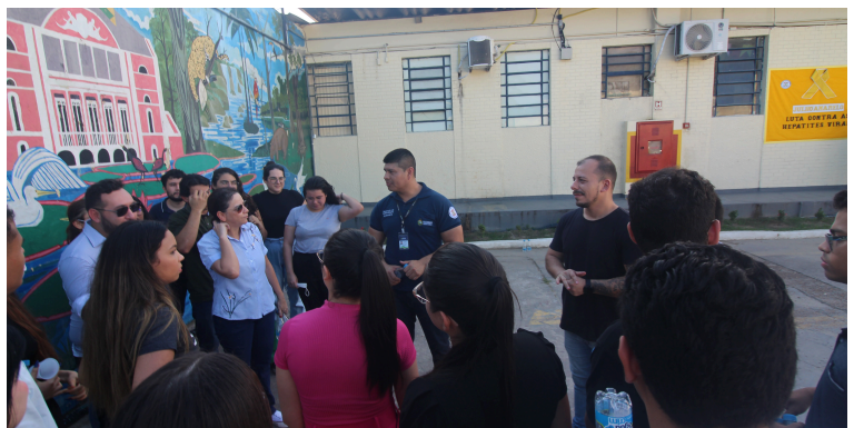
Visita Técnica UEA ao Compaj. Julho de 2023