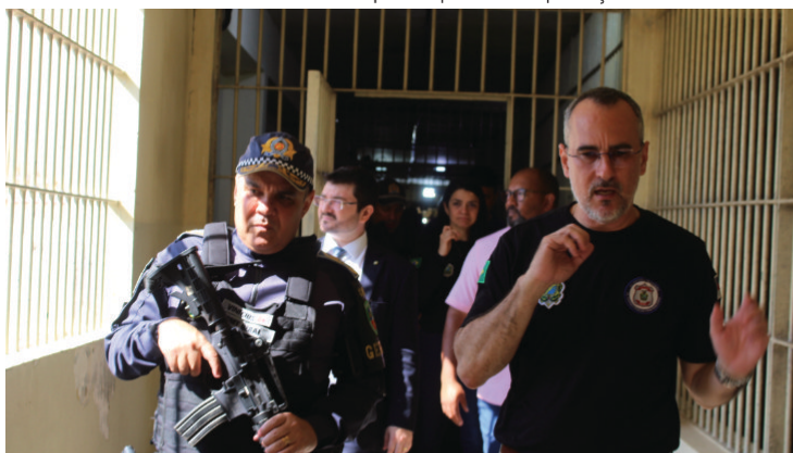
Operação Ceberus é realizada em todas as unidades da capital. Julho de 2023