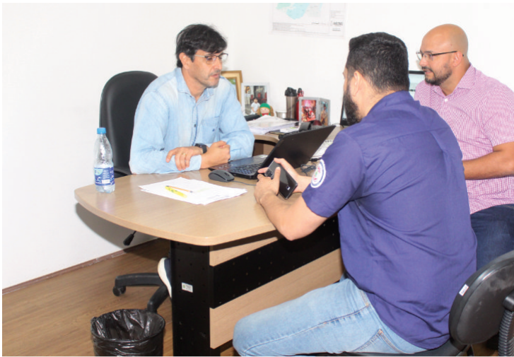
Secretário Executivo em reunião com representantes da SEINFRA. Julho de 2023