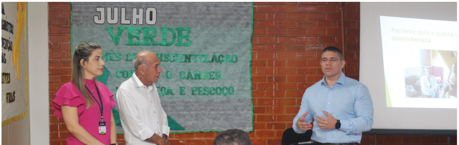
Abertura da campanha "Julho Verde" aos servidores da Secretaria. Julho de 2023