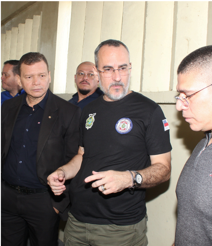
Revista na Unidade Prisional do Puraquequara. Julho de 2023