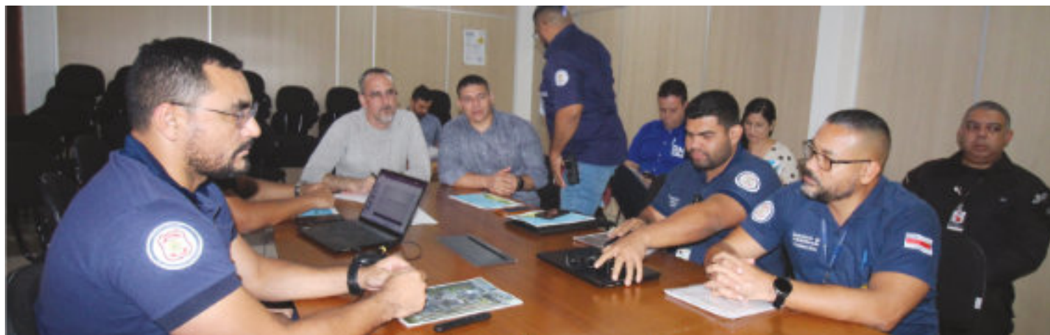
Reunião com os gestores da SEAP.