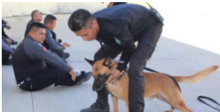
Aula prática do curso condutores de cães