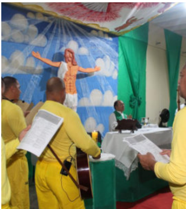
Início da catequese no Instituto Penal Antônio Trindade (IPAT).