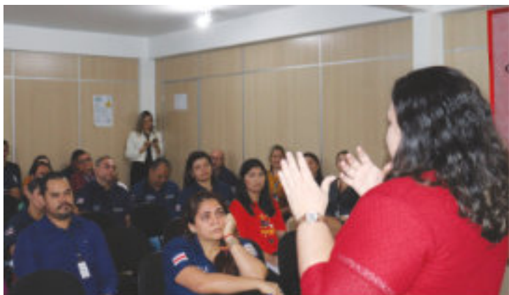
Abertura da Campanha Junho Laranja.