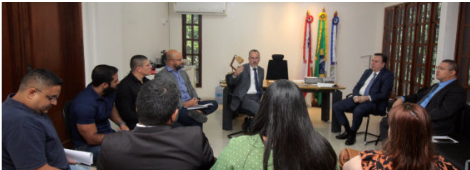
Reunião com o Presidente da OAB Amazonas.