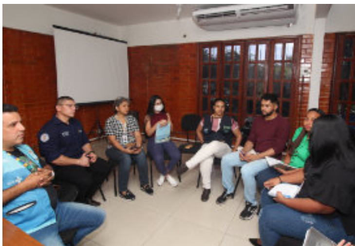
Reunião com representantes da saúde na sede da SEAP.