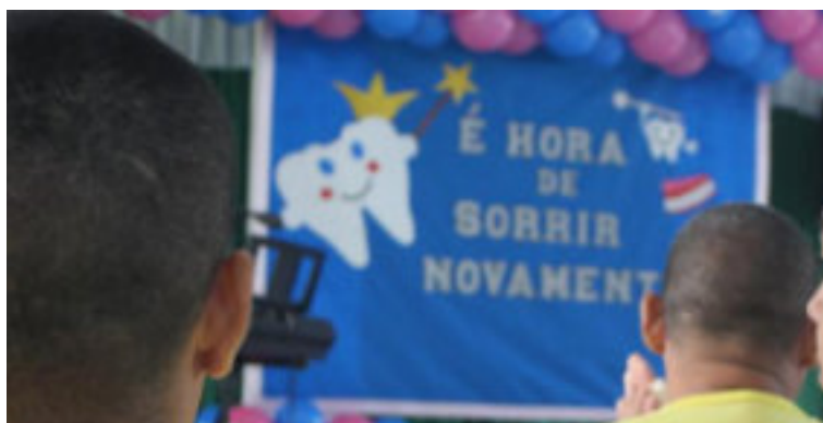
Abertura do projeto "É Hora de Sorrir Novamente".